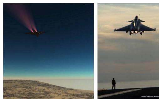
À gauche : Le Geghu, le "Faucon marteleur" d'Enki À droite : le Rafale de l'armée française

Avant que leur assourdissant vacarme perçant le silence de la campagne faillit nous faire avoir une syncope, les deux avions militaires, volant très bas au-dessus de nos têtes, fonçaient droit vers le sommet du Bugarach. Relevons au passage que le Geghu, le "Faucon marteleur" du dieu reptilien Enki, utilisait également cette bruyante tactique d'approche pour terroriser ses ennemis.