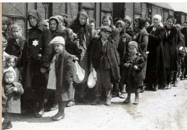
Femmes et enfants juifs sur le quai d'Auschwitz portant "l'étoile jaune".

Il se pourrait bien aussi que la barrière de la langue soit l'un des prétextes qui desservent temporairement la réalisation de notre objectif commun, puisqu'à part deux ou trois personnes dans notre équipe qui le pratiquent un peu, nous ne parlons, lisons et encore moins maîtrisons l'anglais au point d'être en mesure de communiquer avec son groupe, ou converser sur leur forum. Alors même si les traductions en français des transmissions cassiopéennes sont pratiquement réalisées au fur et à mesure qu'elles paraissent, nous n'avons que peu idée du contexte dans lequel ces communications étaient organisées.