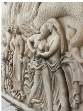
Deux personnages féminins s'adonnant au saphisme sous l'égide d'une créature Abgal à queue de poisson.

Nous devons donc comprendre que les Namlú'u (l'humain primordial parfait) étaient des êtres totalement asexués. Mais en les séparant génétiquement en deux polarités sexuelles, le "dieu" Enki s'était tout de même assuré que ses propres prototypes seraient capables de se reproduire sexuellement, tout en développant progressivement leur autonomie pour acquérir la Connaissance des initiés. L'initiation au "Secret des Giš" ou "Secret des Étoiles sombres" fait référence au féminin éternel et à l'importance de développer également les échanges et partages homoérotiques de l'énergie sexuelle/créative du féminin et entre féminins pour ramener un nouvel équilibre créatif dans la société terrestre.