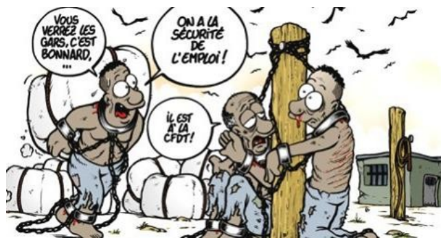
"Sale ère" pour les moutons n'est-il pas ?!

Ne serait-il donc pas plus avisé de définir le travail – surtout s'il est contraire à la liberté d'être – comme symbole d'une souffrance par lequel l'individu se laisse torturer, parfois même jusqu'à endurer les pires maltraitances, contre un salaire, de l'argent ?