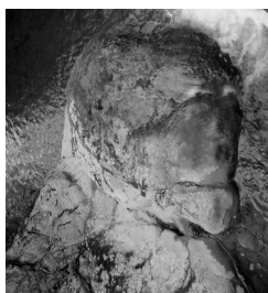
Colosses en pierre

Ce n’est pas fini ! Ce sont désormais les gardiens les “plus physiques” (les plus denses) qui se présentent sous forme d’esprits de la nature dans un rocher et dans l’eau. Il s’agit d’un colosse et d’un Urmah (guerrier félin émissaire de la “Source”).