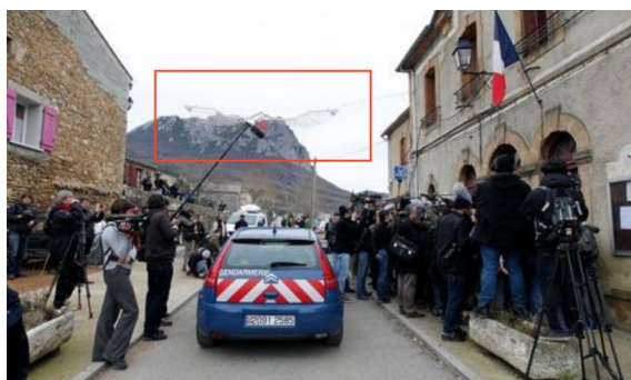
La guirlande de Noël représentant Nibiru. Serait-ce un hasard ?

En écrivant ces lignes, j'ai fermé accidentellement la page Internet que je consultais, et suis tombé sur une photo du journal le Figaro 3 .